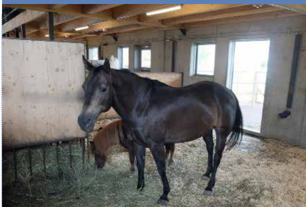
Mäser «im Feld», Katja Mäser, 9437 Marbach

Infrastruktur: Der auf Individualitäten konzipierte Stall ermöglicht verschiedensten Pferdetypen ein stressloses Leben. Eine gut ausgenützte Topographie bietet viel Abwechslung und zusätzliche Anreize.