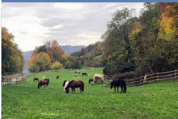
Schryberhof, Michael Mathys, 5214 Villnachern

Infrastruktur: Ein in einen Landwirtschaftsbetrieb durch-dacht eingegliedertes Pferdebereich. Die aus einer solchen Kombination entstehenden Vorteile zeigen sich auch an der abwechselnd benutzten Weidefläche in Kombination mit den Kühen.