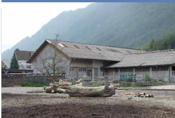
St. Katharinenhof, Simone Paladino, 8865 Bilten

Infrastruktur: Was sich rund um die freistehende Scheune realisieren liess, um zusätzliche Anreize und mehr Bewegung zu bieten, wurde mit viel Gefühl für die Pferdebedürfnisse umgesetzt.