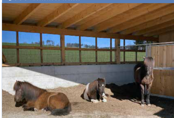
Islandpferdehof Wald, Astrid Michel 3086 Zimmerwald

Infrastruktur: Ideenreich gebaute Anlage mit Stallgebäude und einer zweiten, ebenfalls computer-gesteuerten Futterstation auf unterschiedlichem Niveau. Dazwischen mehrere Stationen mit Beschäftigungsanreizen.