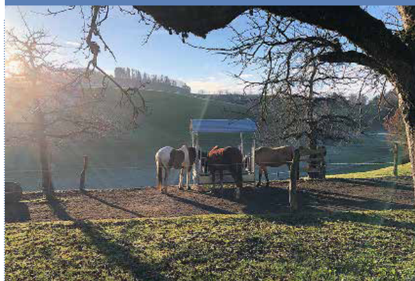
Reitstall Weier, Kurt Krebs, 3096 Oberbalm

Infrastruktur: Reichliches Platzangebot in und um bereits bestehende Gebäude herum bietet einen abwechslungsreichen Lebensraum mit vielen Bewegungs- und Beschäftigungsanreizen vom Stall bis auf die Weiden.